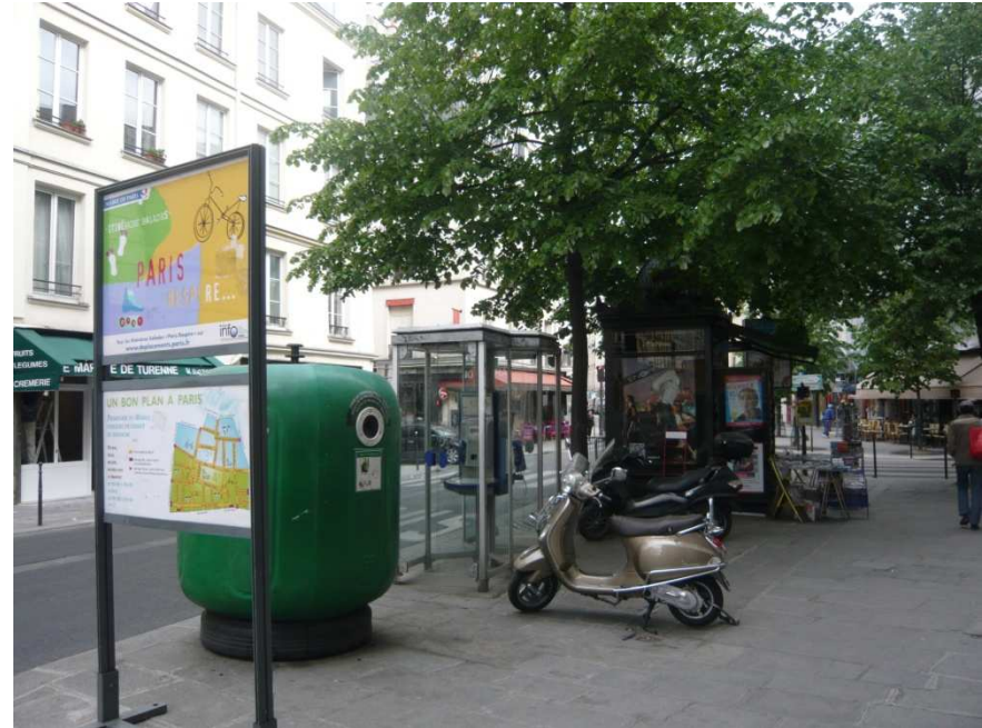
Accumulation de mobilier urbain, Angle rue de Turenne, rue des Francs-Bourgeois.