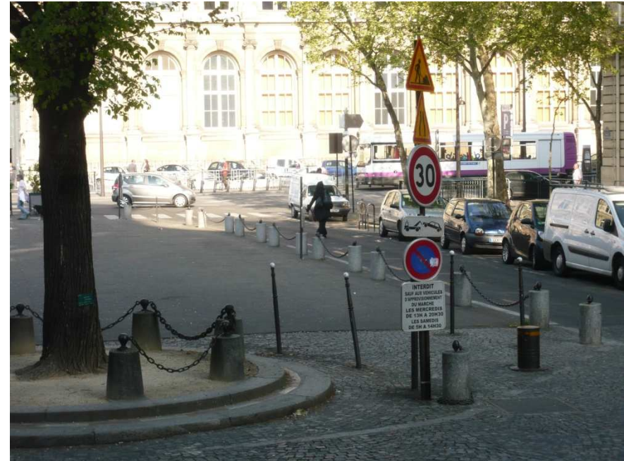
Place Saint-Gervais : Superposition de panneaux signalétiques.