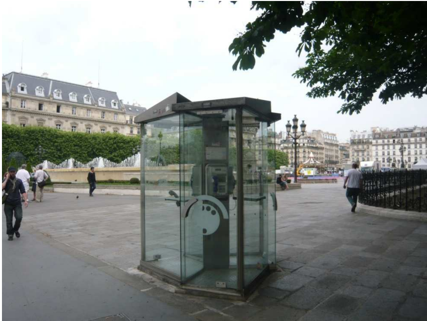
Une cabine téléphonique, à l'entrée de la place de l'Hôtel de Ville.