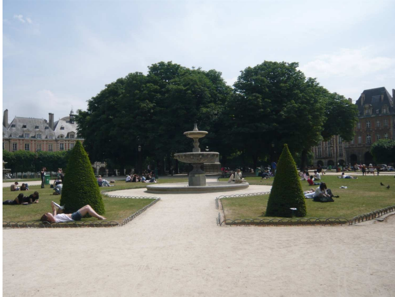
Statue de Louis XIII, cachée au centre de la place des Vosges.