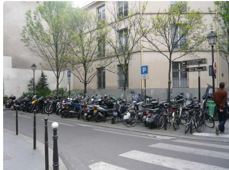
25 rue des Blancs Manteaux, arbustes en recoin.