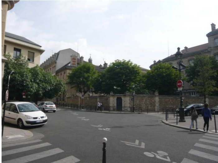
Intersection devant l'Hôtel de Sens.