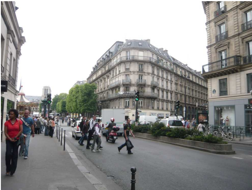
Rue du Renard. Séparateur de chaussée végétalisé.