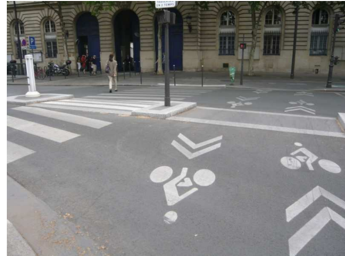
Intersection rue de Lobau et Quai de l'Hôtel de Ville.