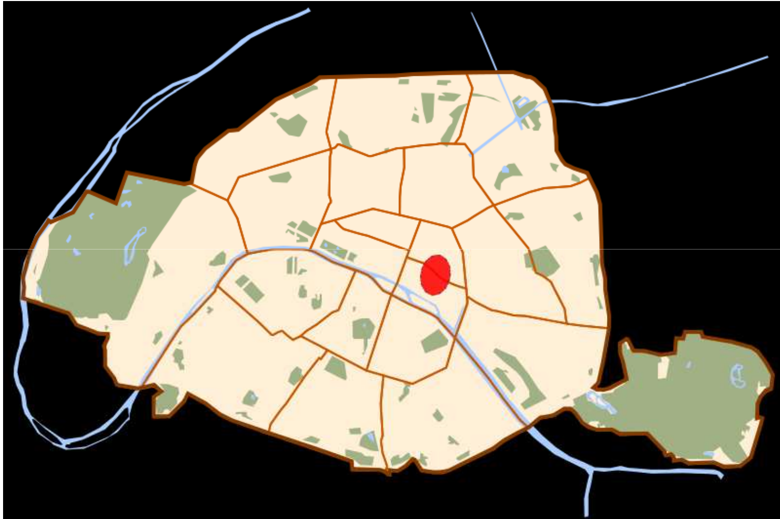
Localisation du quartier du Marais dans Paris