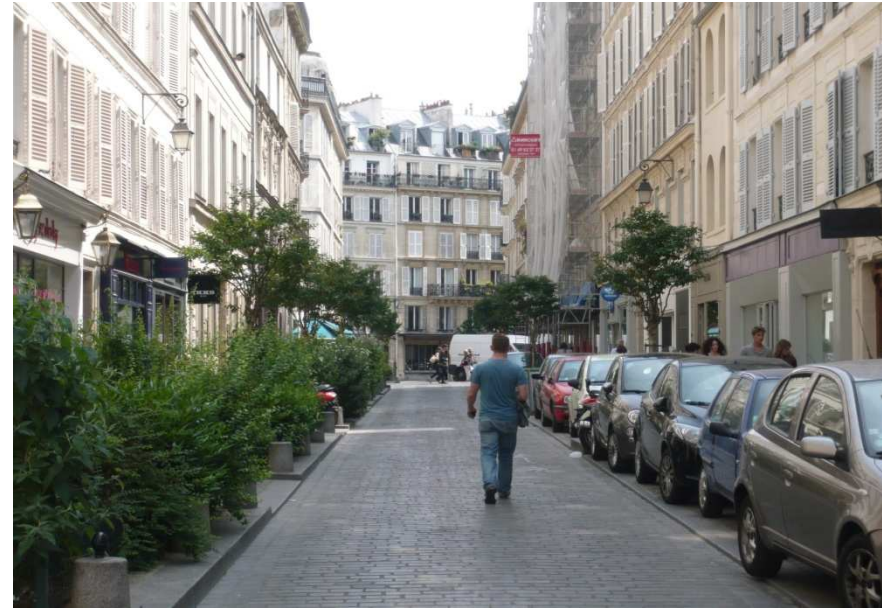
Rue des Rosiers