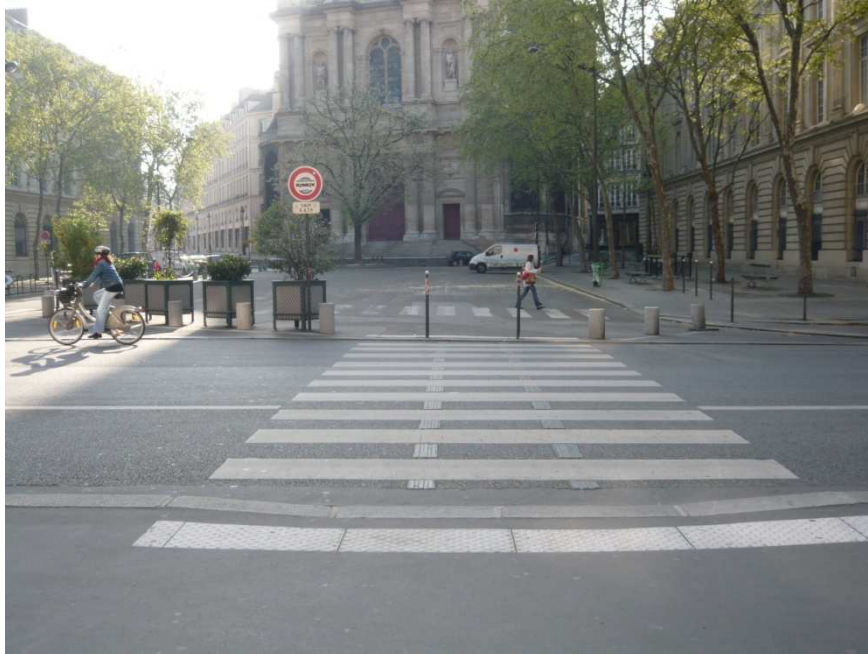
Place Saint-Gervais : Différents types de mobilier (jardinières, potelets hauts et bas), pour un même usage, celui d'empêcher l'accès et le stationnement.